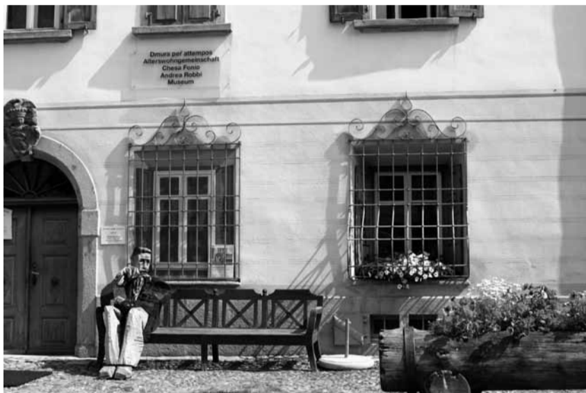
Freie Pflegeplätze sind rar – Lösungswege gibt es verschiedene

Dabei müsste gar nicht jeder Betagte mit gesundheitlichen Einschränkungen in einem Heim versorgt werden. Schon heute wird ein grosser Teil der Pflege von den Angehörigen selber geleistet und erscheint in keiner Pflegestatistik.