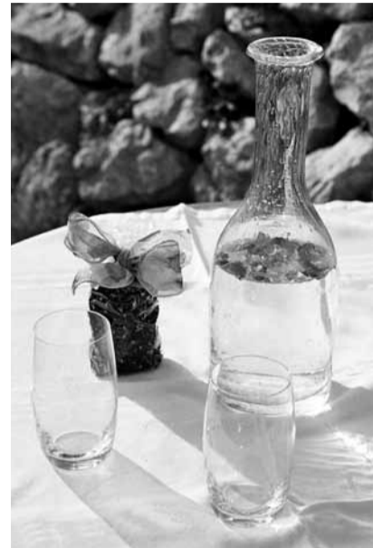
Phytotherapie: Heilkräfte der Natur

reichend Flüssigkeit werden sie also einfach ausgespült, bevor sie Schaden anrichten können. Nun wird ja nachts wenig getrunken und die Bakterien konzentrieren sich in der Blase. Wenn also der Preiselbeersaft abends vor dem Schlafengehen eingenommen wird, kann er zu dieser kritischsten Zeit auch die beste Wirkung entfalten. So konnte in Alters- und Pflegeheimen der Bedarf an Antibiotika zur Behandlung von Blasenentzündungen um zwei Drittel gesenkt werden.