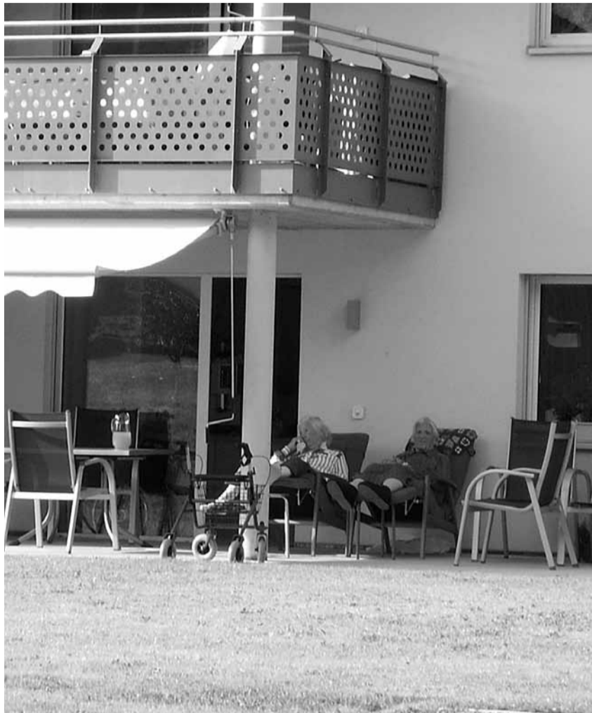
Die Pflegegruppe Prasad-chèr, Scuol, ermöglicht Selbständigkeit trotz Pflegebedürftigkeit