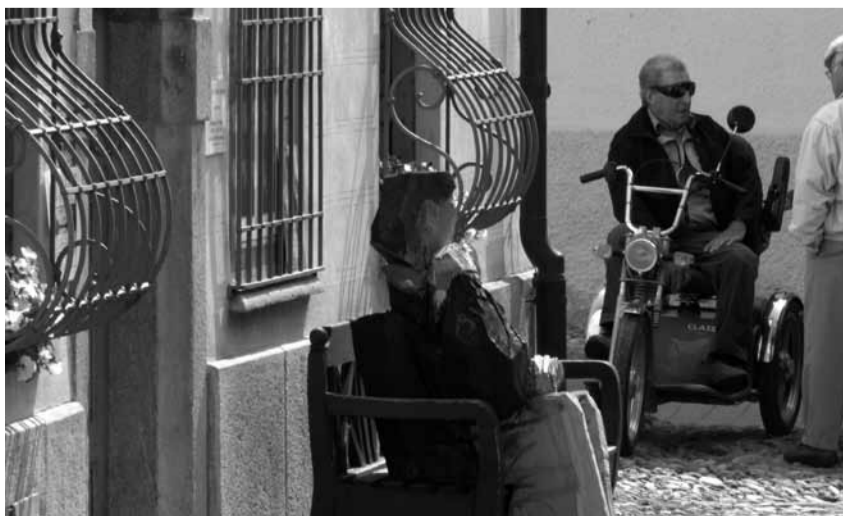
Lebensqualität im Alter dank der Ergänzung von ambulanten und stationären Angeboten

Pflegebedürftigkeit bedeutet nämlich nur in den wenigsten Fällen, komplett unselbständig und ans Bett gefesselt zu sein. In der Regel summieren sich kleinere Einschränkungen und Beschwerden, bis ein Heimeintritt unausweichlich scheint. Mit einem Netz aus gut ausgebauten Betreuungs- und Pflegedienstleistungen liesse sich aber mancher Heimeintritt verzögern oder vermeiden. Denn dies ist der Wunsch der meisten: zu Hause bleiben zu können, auch wenn sich das Alter bemerkbar macht mit Einschränkungen und Behinderungen. Immer häufiger begegnet die Spitex auch dem Wunsch, bis ganz zuletzt in den eigenen vier Wänden bleiben zu können und auch da zu sterben. Dazu braucht es vor allem eine starke Spitex, wie sie von Sils bis Cinuos-chel den Wunsch nach häuslicher Pflege erfüllt. Daneben braucht es aber Alternativen, die in