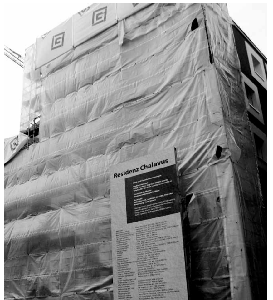
Zentrale Lage, atemberaubende Aussicht und Spitex-Ambulatorium im Haus: bald ziehen die ersten Bewohner in die Alterswohnungen Chalavus St. Moritz