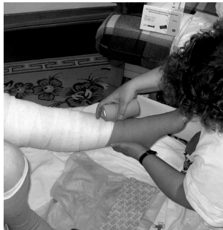
Abend- und Nachtspitex können Einweisungen ins Pflegeheim verzögern oder Entlassungen aus dem Spital beschleunigen – auch im Oberengadin?

Spitex-Zentrum im Zürcher Seefeld. Vor den Fenstern ist es dunkel, im Büro kehrt Ruhe ein. Die Kolleginnen